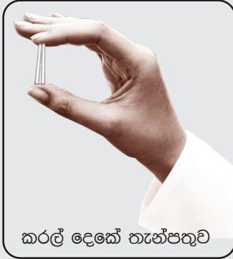
කරල් දෙකේ තැන්පතුව