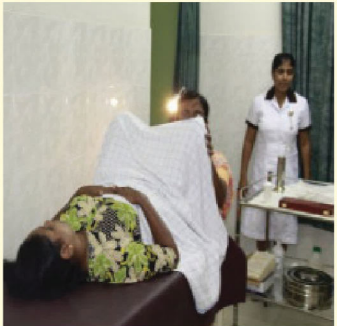
05 ගැබ්ගෙළ පිළිකාවක් පිළිබඳ අනාගත අවදානමක් ඇත්දැයි සොයා බැලීමට පැප් (PAP) හෝ HPV / DNA පරීක්ෂාවක් කිරීම