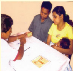
07 පවුල් සැලසුම් සේවා සහ උපදේශන සේවා සැපයීම