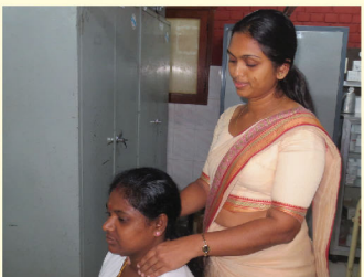
06 තයිරොයිඩ් ග්‍රන්ථිය පරීක්ෂා කිරීම