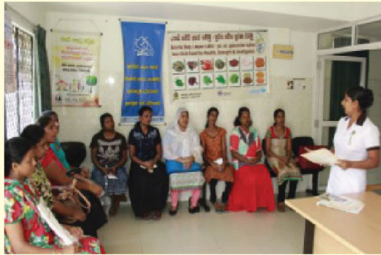
09 වැඩි වයස් කාන්තාවන්ට ආර්ථවහරණය පිළිබඳ දැනුවත් කිරීම