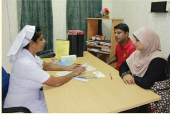
08 ආර්ථව චක්‍රය පිළිබඳ ගැටළු වලට උපදේශන සැපයීම